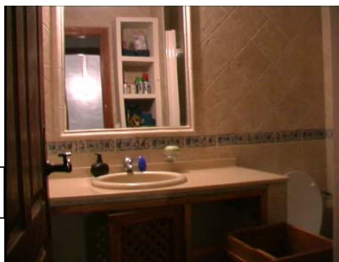
Fra ett av badene