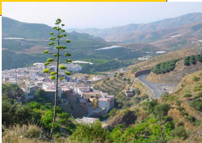
Hele landsbyen Itrabo sett mot syd