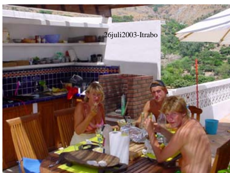
Måltid på takterrassen med utekjøkkenet i bakgrunn.