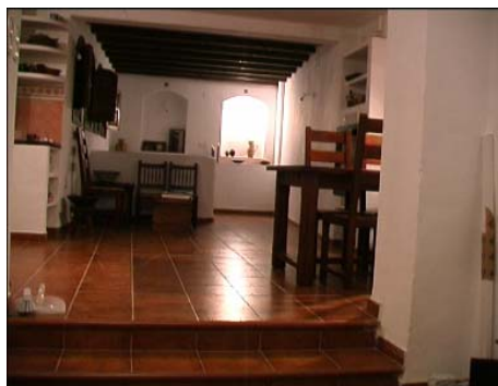
Stue / oppholdsrom